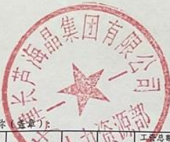
2019年度国有企业工资总额预算执行情况表