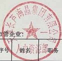
企业负责人履职待遇和业务支出2021年度预算执行情况统计表